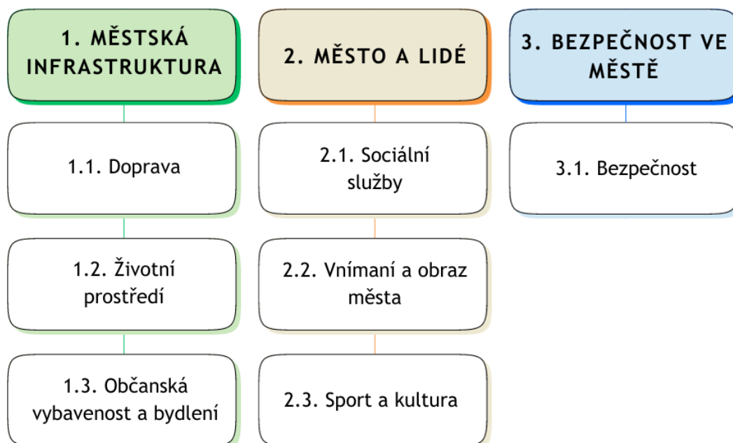
Obrázek 3 Struktura strategických oblastí a prioritních os města

Aktualizace strategického plánu byla zpracována v průběhu roku 2023. Aktualizaci řešila pracovní skupina v rámci odboru rozvoje a investic. Po aktualizaci analytické části byla návrhová část zjednodušena tak, aby se zaměřovala na prioritní cíle města. Po projednání a schválení Zastupitelstvem města Orlová, bude zpracována aktualizace akčního plánu, který bude reagovat na schválenou aktualizaci strategického plánu a navrhne upravený soubor opatření a aktivit. Podle dříve schváleného harmonogramu má být předložen v polovině roku 2024.