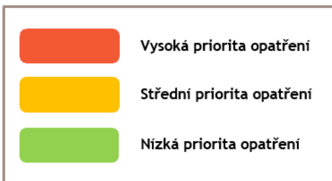
Obrázek 4 Grafické znázornění priority opatření

Akční plán s konkrétními aktivitami navázaných na strategické cíle a opatření bude aktualizován a projednán samostatně po odsouhlasení aktualizace strategického plánu zastupitelstvem města. Podle schváleného harmonogramu v polovině roku 2024 (viz níže).