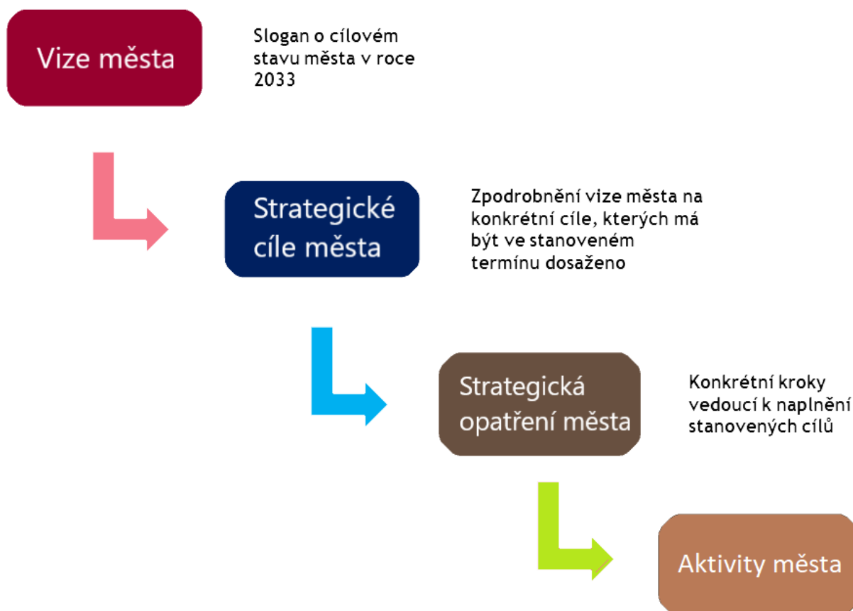
Obrázek 2 Struktura návrhové a implementační části

Strategické vize, programové cíle a strategická opatření jsou dále v tomto dokumentu tříděna dle nadřazených strategických oblastí, respektive prioritních os. Následující schéma zobrazuje přehled prioritních os a strategický oblastí města Orlová pro období 2017-2033. Strategický plán se opírá o tři prioritní osy, resp. rozvojové oblasti města Orlové, a to o bezpečnost ve městě, městskou infrastrukturu, kvalitu života ve městě spojenou s interakcí mezi městem a jeho obyvateli.